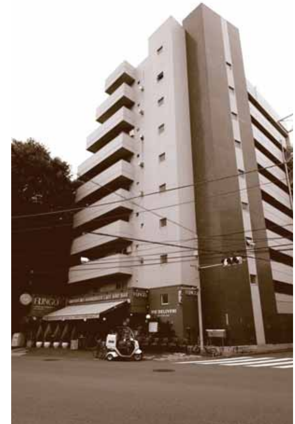
△ 外観 三宿通りに面し交通も便利