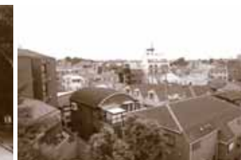
△ バルコニーの眺望 陽当たりも良好