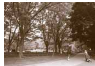
△ 向かい側が世田谷公園(45m)